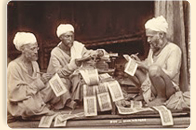
प्राचीन लेखन पद्धति

"मंदिर छो मुक्तिणी मांगल्यक्रीडाना प्रभु" मगर प्रायः सब लोग क्या बोलते हैं? मुक्तिणी के स्थान पर